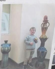
Еще перед концертом мы посещаем в институте небольшие выставки картин или скульптур, они часто меняются. Вообще-то там очень интересно!!!