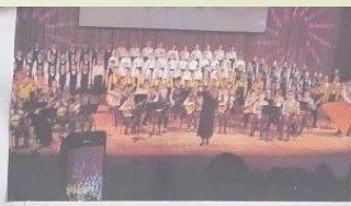
Выступает она в Институте Искусств имени Дмитрия Хворостовского или в Большом концертном зале. Там мы слушаем песни и игру на музыкальных инструментах. В зале всегда много народа, громкие аплодисменты и крики «Браво». Мне очень нравится посещать её концерты!