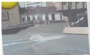
Моя старшая сестра учится в музыкальной школе. Она поёт в хоре и играет на гитаре. Поэтому мы всей семьей несколько раз в год ходим на её концерты.